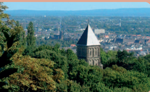
Wunderbarer Blick über Aachen vom Salvatorberg.

Vom Bahnhof Herzogenrath nach rechts auf den Europäischen Wanderweg „E8“ gehen, ab hier immer diesem Wanderzeichen folgen. Nach drei Kilometern überquert der Weg den Fluss „Wurm“ und führt zur Burg Wilhelmstein ①. Weiter auf dem „E8“ bis zum Teuterhof mit seinem Gartenrestaurant und dann zum Blauenstein. Es geht durch eine Unterführung unter der Autobahn A4 hindurch in das Tal der Soers ②. Von hier bietet sich ein herrlicher Blick auf den Lousberg mit seinem Drehturm und auf das berühmte Aachener Reitstadion. Bald ist der Salvatorberg ③ erreicht, ab hier dem Hauptwanderweg folgen, der mit einem schwarzen Dreieck gekennzeichnet ist. Der Weg führt bis zum Aachener Dom ④, wo die Wanderung endet. Von hier aus in 10 bis 15 Minuten zu Fuß zum Hauptbahnhof gehen oder den Bus (verschiedene Linien) ab der Haltestelle „Elisenbrunnen“ nehmen.