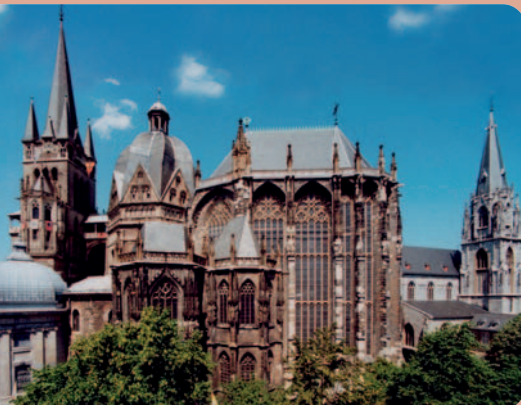
Mittelalterliches Weltkulturerbe: der Aachener Dom.

Herzogenrath – Burg Wilhelmstein – Soers – Salvatorberg – Aachen