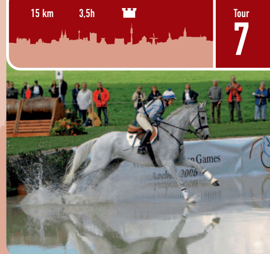
Spannende Reiterspiele: das Reitstadion der Soers.